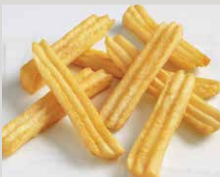
Frites ondulées Lamb's Seasoned® WaveLength Fries® (D07)

Également offerts : Pommes de terre rôties au four Lamb's Supreme® (S0007) Pommes de terre à pelure rouge rôties au four, ail et romarin, coupe triangulaire (AX585)