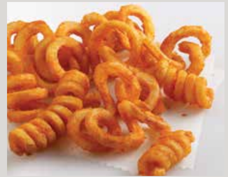
Frites Lamb's Seasoned® Twister Fries® recette originale (D0073)

Également offerts : Curley QQQ's® (Q0004) Frites Stealth® (S0010)