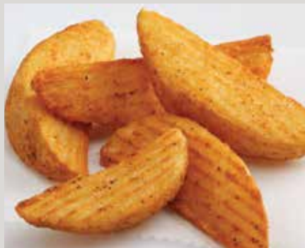
Quartiers en chapelure à saveur de poulet Lamb's Seasoned® Crinkle Deli Wedge® (D17)

Également offert : Frites Generation 7 Fries® (X30)