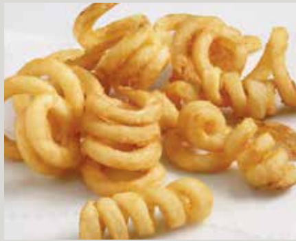
Frites Tater Boy® Crispy QQQ's® Fries (24328)

Également offert : Frites LW Private Reserve® (G0033)