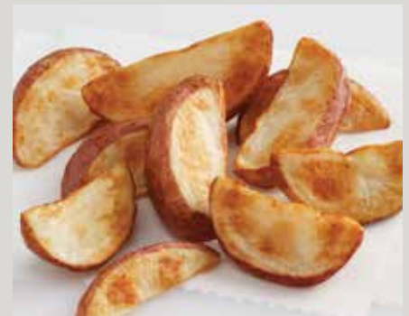
Pommes de terre à pelure rouge rôties au four Alexia®, coupe en quartiers (AX584) Non assaisonnées (AX586)

Également offerts : Quartiers ondulés minces (D19) Bouchées (D20) Quartiers ondulés minces Frites Generation 7 Fries® (X24)