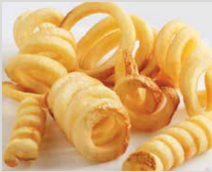
Frites Twister Fries® (C0077) avec pelure

Également offert : Frites LW Private Reserve® (G0033)