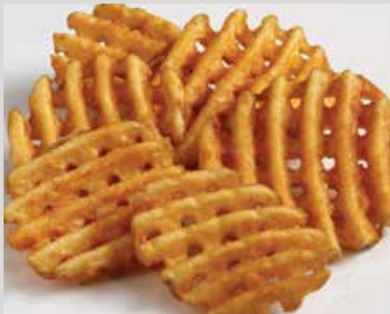
Frites gauffrés Lamb's Seasoned® CrissCut® recette originale (D23)

Également offerts : Recette épicée (34Z) Frites épicées Western Spicy Crispy QQQ's® (24322)