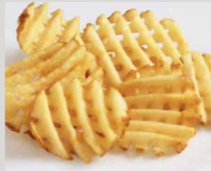
Frites CrissCut® (P55) avec pelure

Également offerts : Recette épicée (Y0066) Frites aMAIZEing Fries® (P26)