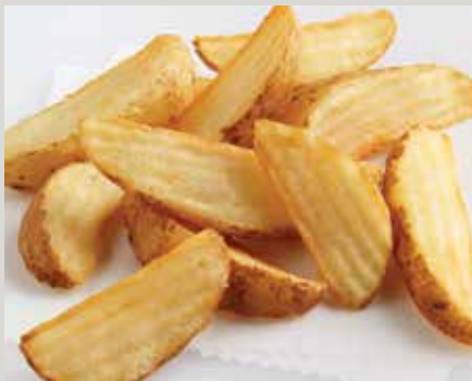
LW Private Reserve® coupe en quartiers ondulés (33D)

Également offert : Frites Generation 7 Fries® (X30)