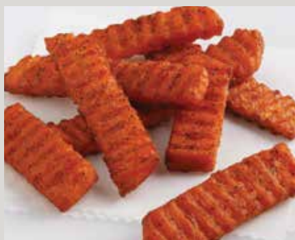
Frites assaisonnées Sweet Things® RibCut® (L0097)

Également offerts : Frites Sweet Things® WaveLength Fries® assaisonnées (L0082)