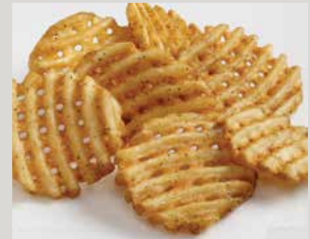
Mini frites gauffrés à la mode du Sud Lamb's Seasoned® (K0120)

Également offerts : Frites Stealth® avec pelure (S15) Frites LW Private Reserve® (33L) Frites Yukon Selects® (Y1005) Frites Sweet Things® (L0090)